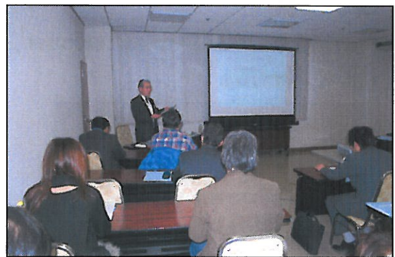
内容となっております。

「人材力養成講座」を開催致します。本講座は、ビジネスに携わる全ての人に必要なが眼力・発想力・情報収集分析力・企画力・開発力・商品力・販売力を身に付けて頂くために開催するもので、群馬工業高等専門学校講師陣をお迎えし、体験談を中心にした「分かりやすい・すぐに役立つ・親切丁寧」な